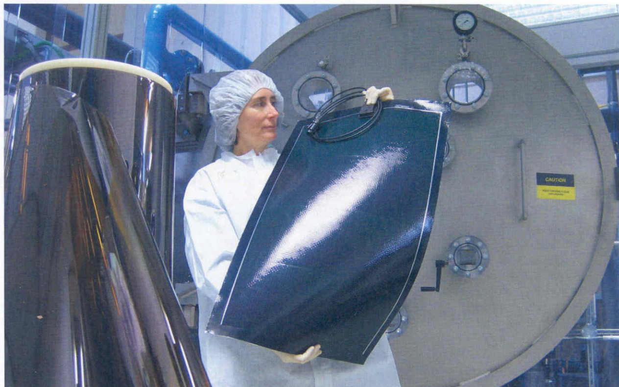
Dünnschicht-Solarzellen aus der Pilot- Produktion in Dübendorf.